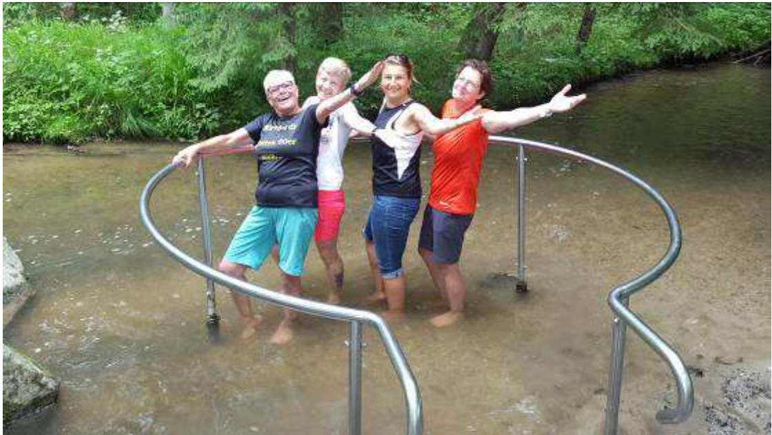
3. Tag: Start mit Wechselgüssen, Wanderung mit Kneippbecken, dann Massagen und Einkehrschwung