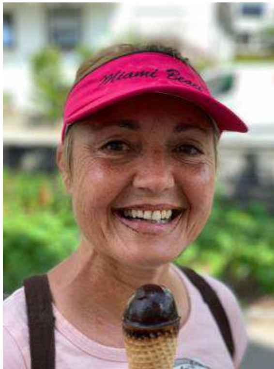
Schön wars – Mädels