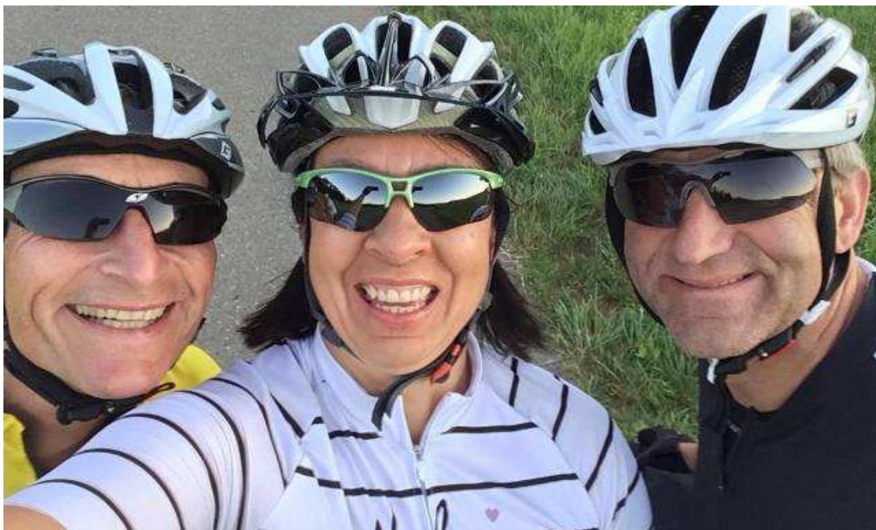
Alb Extrem am heißen Sonntag, 30. Juni 2019 – morgens noch alle frisch....