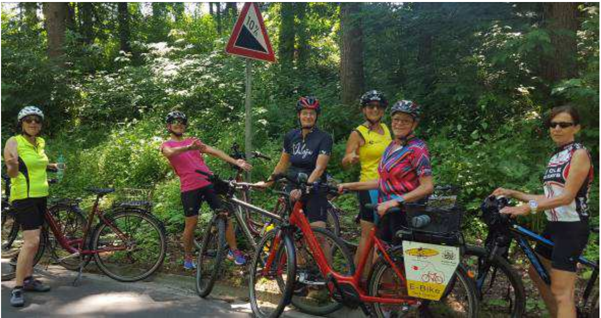
1. Tag: Radfahren mit E-Bike bis 3-Gang-Rad mit Einkehr im Biergarten